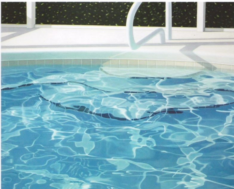
BOWEN Ronald ( E )

P48/ «Sortie de piscine» huile (130x162)