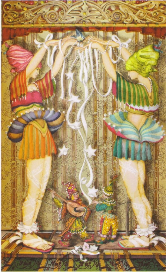
BOURGEAUD VERSIN Christine ( E ) Médaille de bronze 2012

P47/ «Manipulation» tech. mixte (200x122)